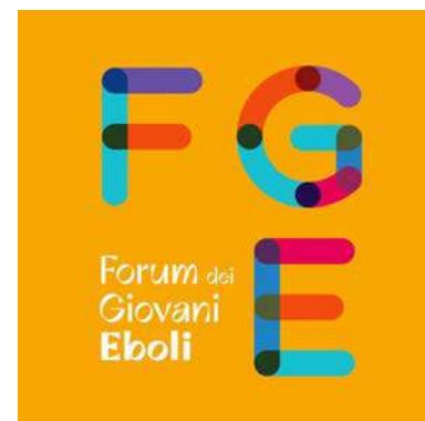
IN ALTO IL LOGO DEL FORUM DEI GIOVANI A SINISTRA IL MUNICIPIO DI EBOLI

2026, seguendo le modalità indicate nell'avviso pubblico. Un passaggio fondamentale per chi intende mettersi in gioco e contribuire alla definizione delle politiche giovanili cittadine. L'amministrazione comunale sottolinea come il Forum rappresenti «uno spazio di crescita democratica e responsabilità civica», invitando i giovani a partecipare attivamente sia alla fase elettorale